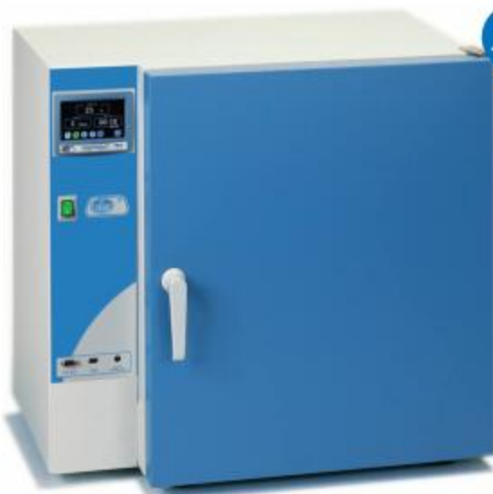
Digitheat型号, Part No. 2001251, 2001252 和 2001254