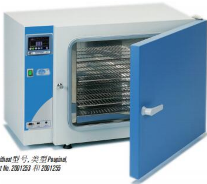
Digitheat型号, 类型 Poupinel, Part No. 2001253 和 2001255